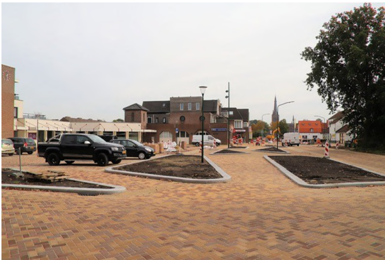
Afbeelding: bestratingswerkzaamheden Raadhuisplaza

Eerst nog even terug naar fase 3. We zijn na de zomer gestart met de derde fase. Het werk in het centrum van Heeswijk-Dinther is voor de inwoners het meest zichtbaar. In dit deel veroorzaken we de meeste hinder rondom het centrum en kunt u soms letterlijk niet om het project heen. Omdat het werkvak steeds een stukje opschuift is het zo nu en dan even nadenken hoe de winkels en woningen bereikbaar zijn en via welke route.