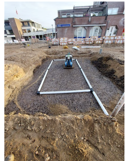
Afbeelding: Boomgranulaat onder hoofdrijbaan

Door de afsluiting van de Traverse kan het openbaar vervoer niet door Heeswijk – Dinther heen rijden, daarom zijn er nu twee opstapplaatsen: ter hoogte van de kerk in Heeswijk én een tijdelijke halte op Laag Beugt ter hoogte van de rotonde Hulsakker. Deze situatie blijft in fase 3 en hoogstwaarschijnlijk ook in fase 4 van toepassing.