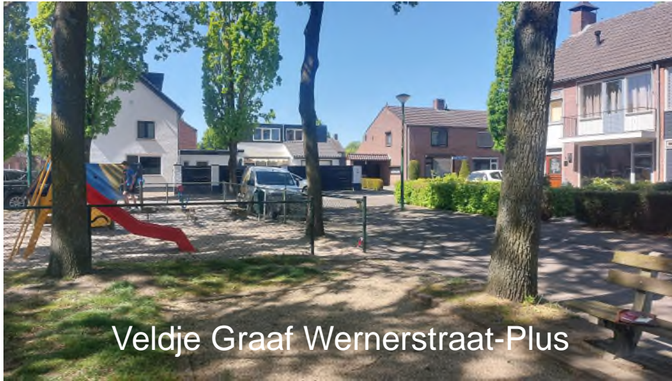
Veldje Graaf Wernerstraat-Plus